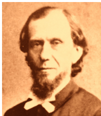
Andrew Murray 1828-1917